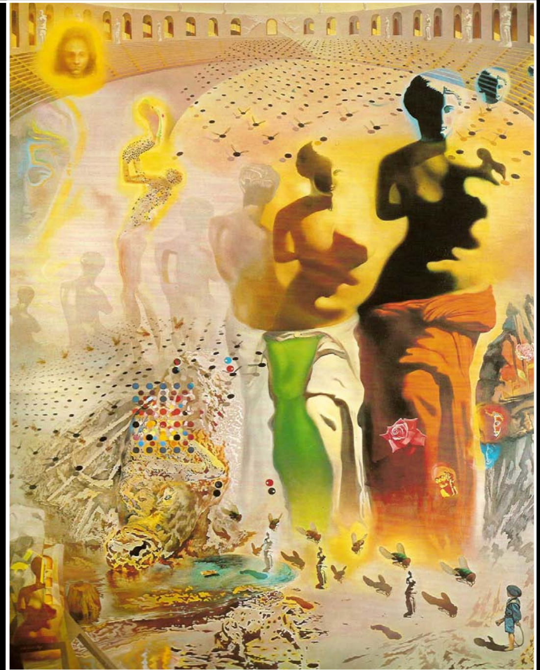
Artista Salvador Dalí Titulo The Hallucinogenic Toreador Ano 1968-1970