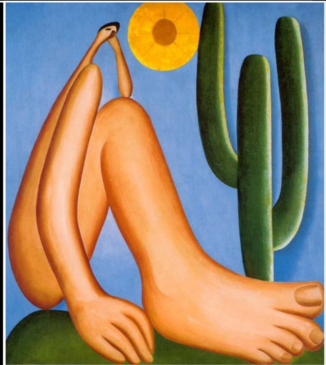
Artista Tarsila do Amaral Ano de 1928 Titulo Abaporu