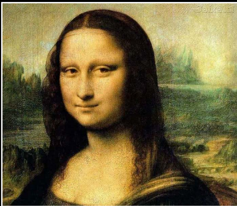
Artista Leonardo da Vinci Título Mona Lisa Ano 1503-1519

Público estimado de 6.000 (seis mil) pessoas.