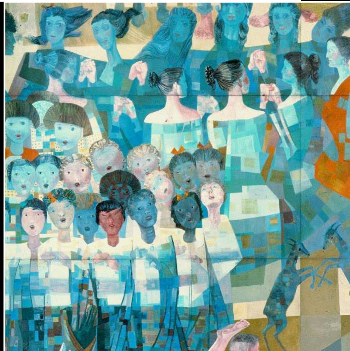
Candido Portinari Painel Paz Ano 1952 a 1956

Se já não temos uma boa visitação aos museus daqui, o que diremos sobre o nosso conhecimento acerca dos grandes museus internacionais, e das obras e artistas mais importantes da humanidade que se encontram pelo mundo?