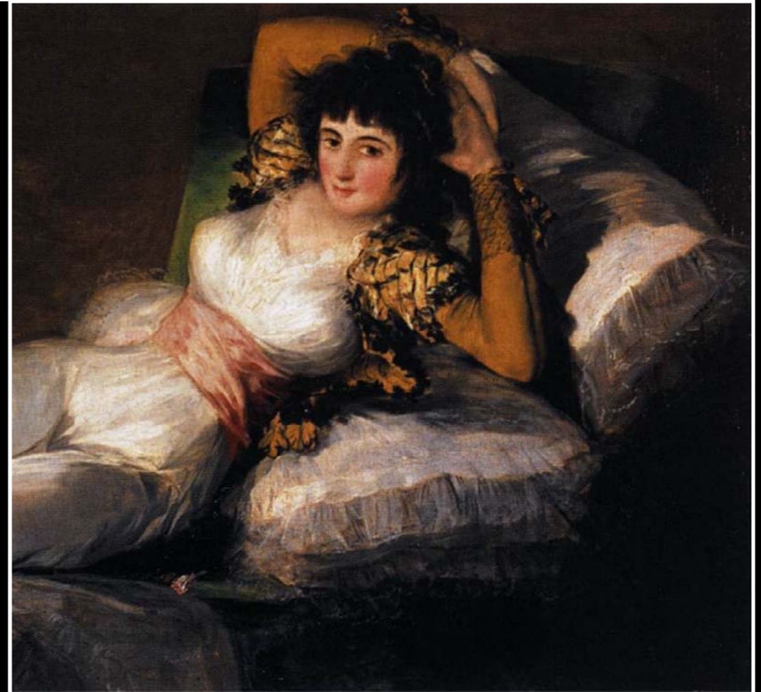
Artista Francisco Goya Titulo La maja vestida Ano 1800-1805